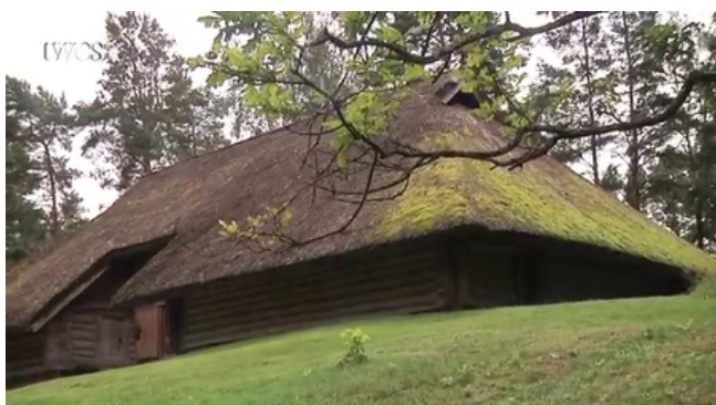
Vidzemes zemnieka dzīvojamā ēka