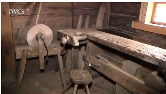
Amatnieka darba galds