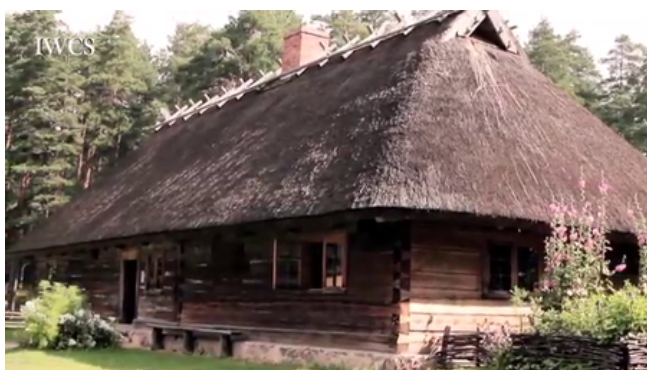
Kurzemes zemnieka dzīvojamā ēka