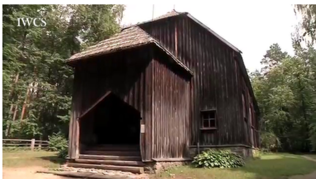
Usmas vecā baznīca