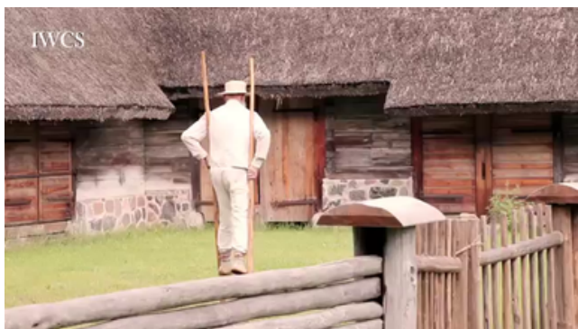
Koka kājas - ņekavas